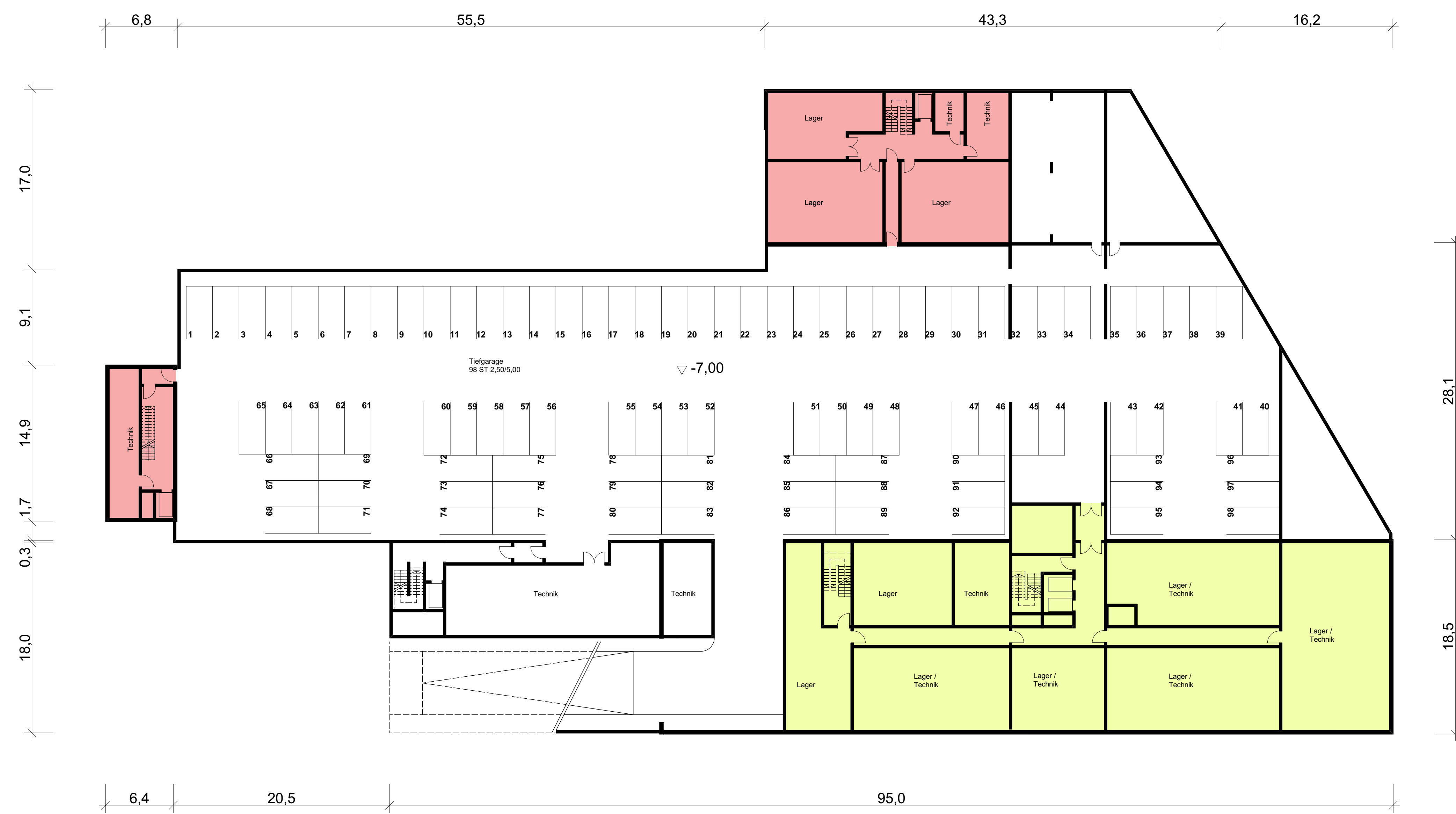
Grundriss 2. Untergeschoss M 1:250